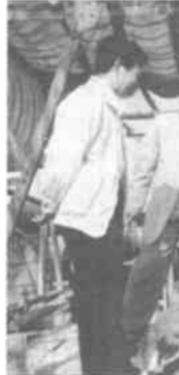
广饶县自来水管网最近连续成功地钻出两眼高产优质水源井，两井并网使用，将大大缓解自来水管网不足的矛盾。（徐秀丽 摄）

本报讯 市农机系统根据“三夏”特点，科学组织，精心调度，合理安排，跨区作业机械早落实。据统计，今年参加“三夏”农机作业的小麦联合收割机械已达到450台以上，其中，跨区作业的30台，跨区作业的80台，跨区作业的180台，并为跨区作业的机械发放了全国或全省内通行证。目前，已有12台联合收割机于5月18日奔赴河南省参加小麦联合收获跨区作业。（本报通讯员）