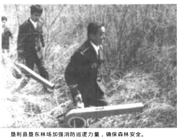
垦利县垦东林场加强消防巡逻力量,确保森林安全。

业的重要步骤,也有利于保持香港的长期繁荣、稳定和发展,有利于我国的社会主义现代化建设。(2)香港问题的圆满解决,有利于维护亚洲和世界的和平,并为通过谈判和平解决国与国之间历史遗留问题和国际争端提供了范例。(3)香港问题的圆满解决,有利于台湾问题的解决。台湾问题完全属于中国的内政问题,因此与香港问题的性质不同,但是“一国两制”的构想对解决台湾问题是同样适用的。通过和平方式解决香港问题,对台湾当局和台湾人民肯定将产生深远的影响,有利于促进祖国和平统一大业的早日完成。(4)香港问题的圆满解决,消除了中英两国关系前进道路上的障碍,这是中英两国政府友好合作的共同成就。中英两国对于保持香港的稳定与繁荣有着共同的利益,因此,只要中英两国政府本着在会谈中所体现的友好合作关系,密切合作,就一定能保证联合声明的顺利贯彻执行,香港平稳过渡,从而使中英两国之间的友好合作关系得到进一步的巩固和发展。 香港知识介绍